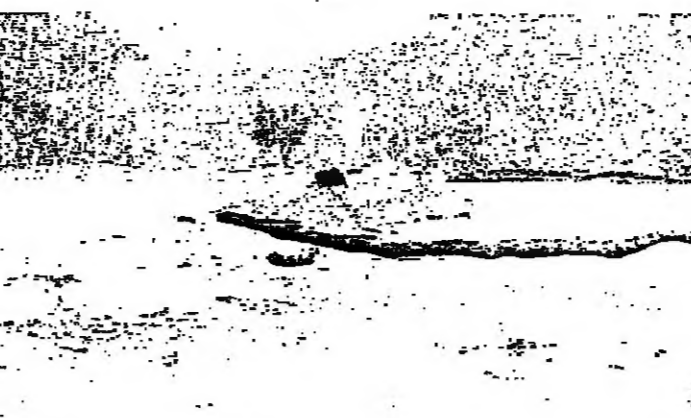
المصلح - الطوبية (اسماعيل حمدان)